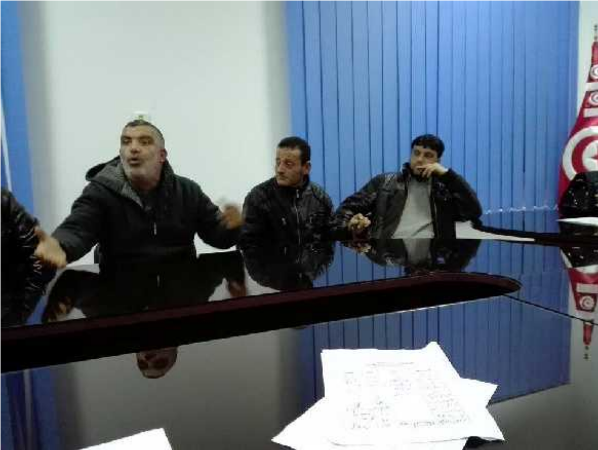
رئيس النيابة الخصوصية شهيدة الحشاني